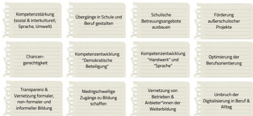
Abbildung 2: Handlungsfelder des Neustadter Bildungsbüros; eigene Erhebung

Basis der Arbeit des Bildungsbüros ist die Gründung und Pflege von Netzwerken, die die jeweiligen Bildungsthemen, wie beispielsweise Demokratiebildung, MINT (Mathematik,