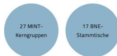
Abbildung 4: Anzahl der Kerngruppen bzw. Stammtischtreffen, Stand Dezember 2025; eigene Erhebung

Förderungen informiert. Nach Themen aufgeteilt, befinden sich 170 Personen im MINT-Netzwerk und 180 im BNE-Netzwerk. Darüber hinaus gibt es für jedes Thema eine Kerngruppe, bei BNE unter dem Titel „Stammtisch“ gefasst. Hier wird nochmal intensiver an den jeweiligen Themen gearbeitet und konkrete Projekte umgesetzt. Im Bereich MINT haben bisher 27 Kerngruppentreffen stattgefunden, bei BNE waren es 17.