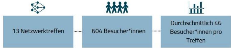
Abbildung 1: Anzahl der Netzwerktreffen, Besucher*innen sowie durchschnittlichen Besucher*innen pro Netzwerktreffen, Stand Dezember 2025; eigene Erhebung

„Datenbasiertes Kommunales Bildungsmanagement“, kurz: DKBM, war das Ziel des Bundesprogramms „Bildung integriert“. Im Oktober 2016 startete dieses Vorhaben nach erfolgreicher Bewerbung in Neustadt als eine von acht Kommunen in Rheinland-Pfalz. Ziel des durch Mittel des Europäischen Sozialfonds geförderten Programms war es, das lebenslange Lernen auf der