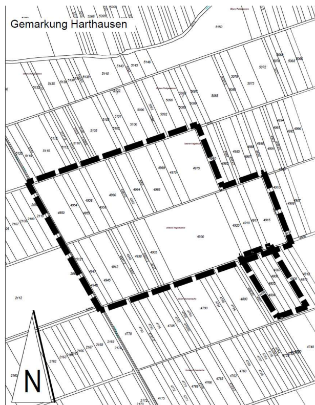
Basiskarte: Liegenschaftskarte der Vermessungs- und Katasterverwaltung. Aus drucktechnischen Gründen unmaßstäblich verkleinert.