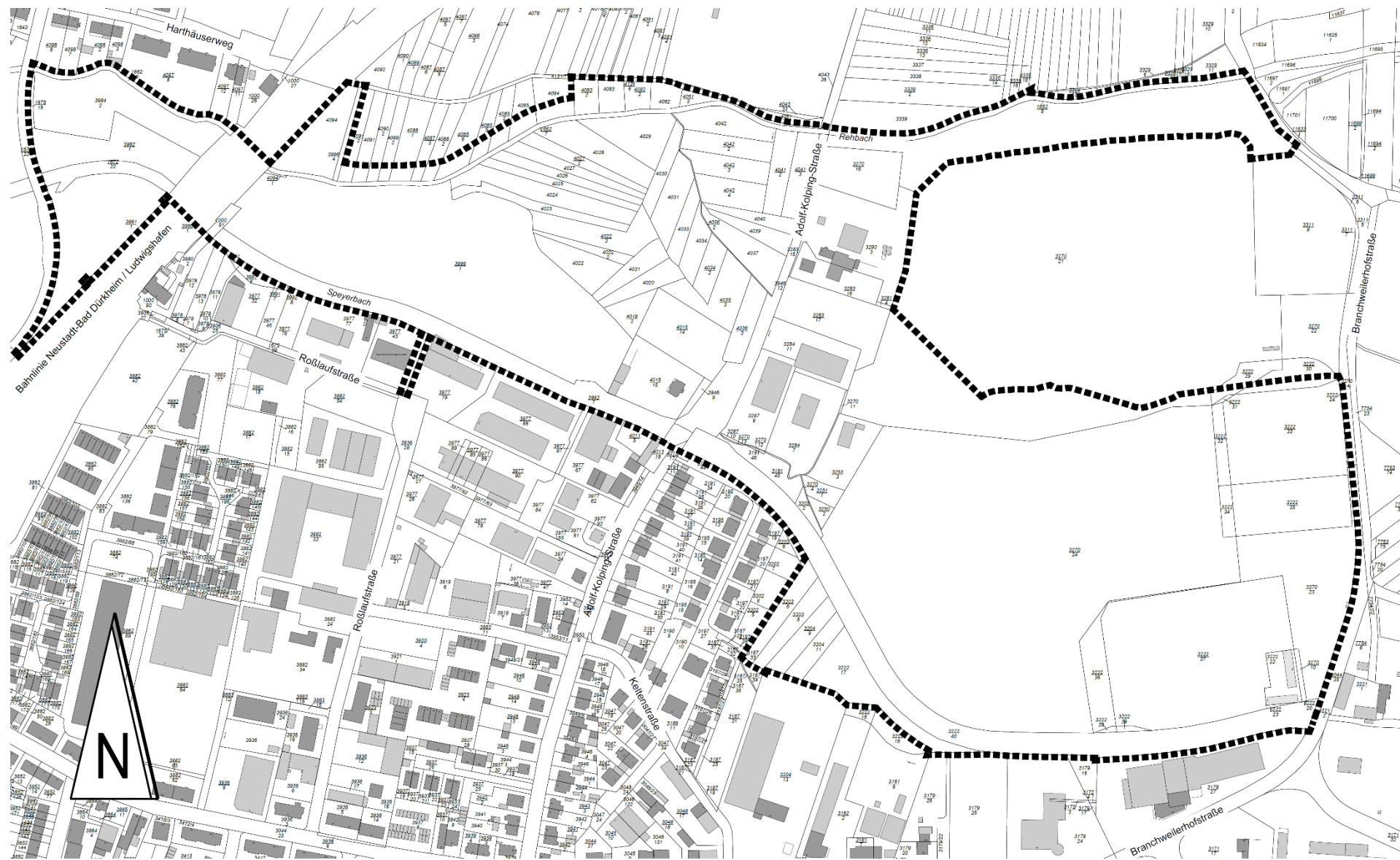
Basiskarte: Liegenschaftskarte der Vermessungs- und Katasterverwaltung. Aus drucktechnischen Gründen unmaßstäblich verkleinert